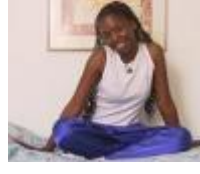
Situation n° ___