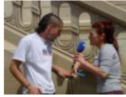
Situation n° ___