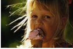
Situation n° ___