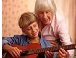
Situation n° ___