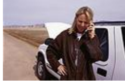
Situation n° ___